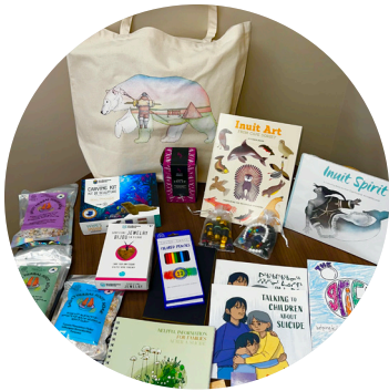
Diocèse de Churchill-Baie d'Hudson

✦ Nous sommes fiers de souligner certaines des organisations incroyables que le Fonds a soutenues. Chaque projet vise à aider les communautés Autochtones à guérir et à faire progresser la réconciliation pour tous. ✦