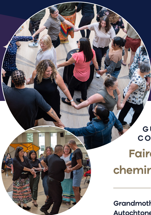
Diocèse de Hamilton