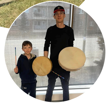
Diocèse de Saskatoon - Comité subventionnaire

Les enseignements traditionnels sont transformateurs pour les familles Autochtones à risque, car ils les lancent dans un voyage de guérison et soutiennent leur succès. Bon nombre des familles qui participent au programme font face à la participation des Services de protection de l'enfance, mais sont impatientes d'être parent d'une nouvelle façon.